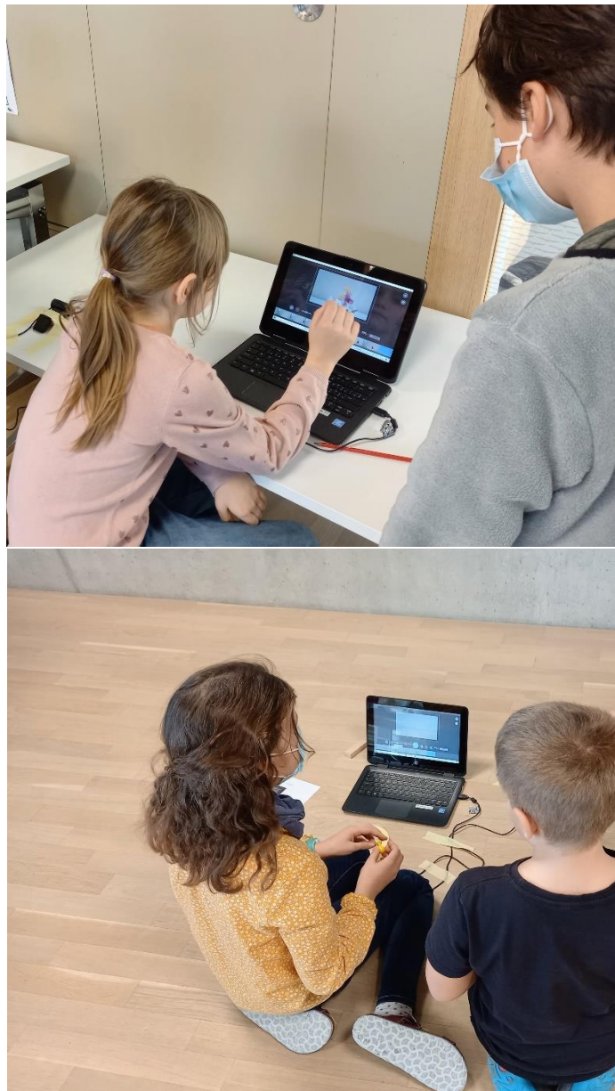
Les élèves de 7H expliquent aux 3-4H comment utiliser le logiciel de Stop Motion.