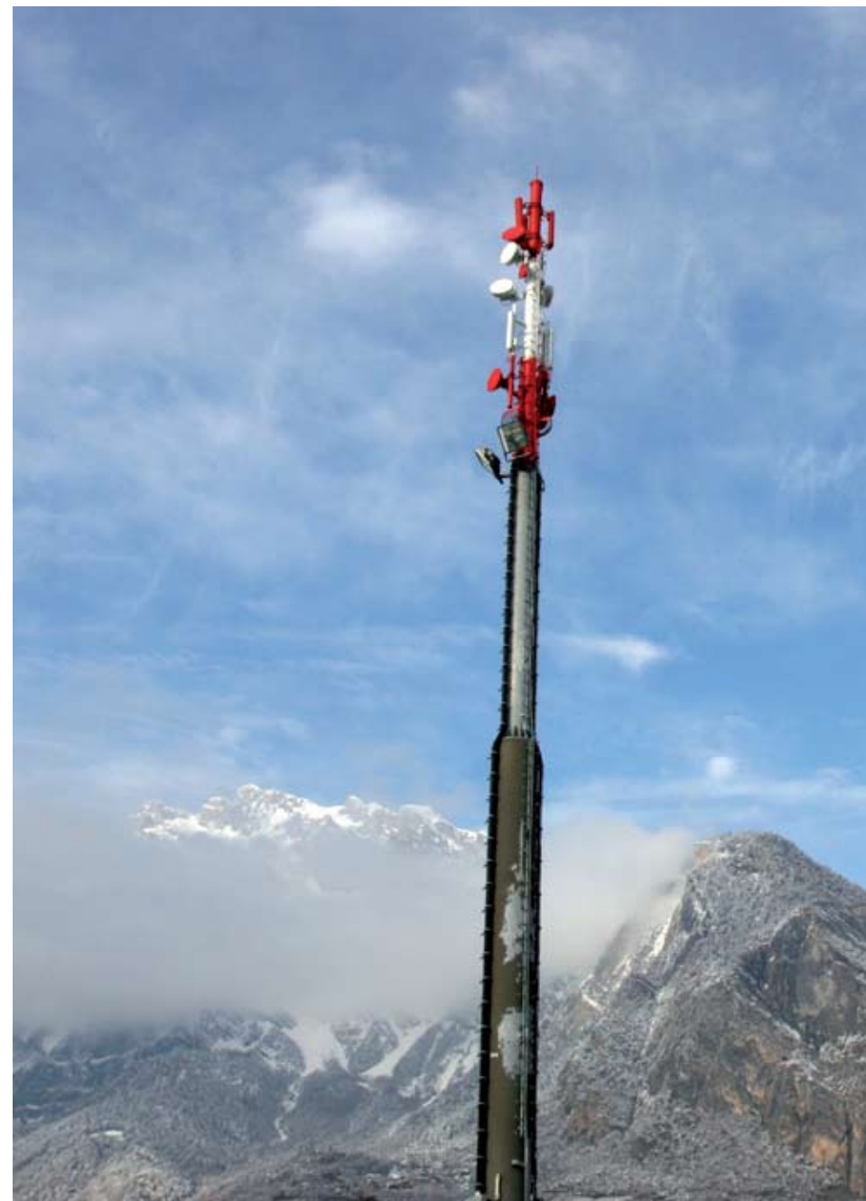
une des antennes de téléphonie «mobile» à St-Pierre-de-Clages