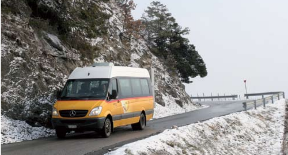
les transports scolaires communaux à disposition des habitants de la commune de Chamoson

Un large territoire, une population répartie dans plusieurs hameaux, deux écoles, ceci implique un réseau de transport scolaire important. Nous sommes également conscients des difficultés à utiliser les transports publics pour se rendre à la gare CFF de St-Pierre-de-Clages, pour accéder à Chamoson à la ligne de Car-Postal ou pour atteindre simplement les divers commerces de la commune. Afin d'améliorer l'offre de transport et la mobilité des personnes, nous avons décidé à titre d'essai