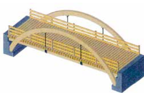
La nouvelle passerelle de Champ Neuf prendra la forme d'un pont fusible, qui pourra être emporté sans danger en cas de crue.

La nouvelle passerelle de Champ Neuf sera quant à elle posée dans le courant de l'été, sous la forme d'un pont fusible en bois. L'ancienne avait dû être retirée pour éviter qu'elle soit emportée et provoque des dégâts dans sa chute. Prototype développé par le Service des forêts, des cours d'eau et du paysage du canton du Valais, le nouveau modèle est non seulement voué à être emporté en cas de crue, mais aussi et surtout à se disloquer, afin d'éviter tout embâcle. La structure sera par ailleurs capable de supporter jusqu'à 13 tonnes, permettant ainsi le passage des véhicules et engins pour le nettoyage du lit en cas de besoin. Le coût de la passerelle, d'environ 300'000 francs, sera subventionné à 65% par le Canton.