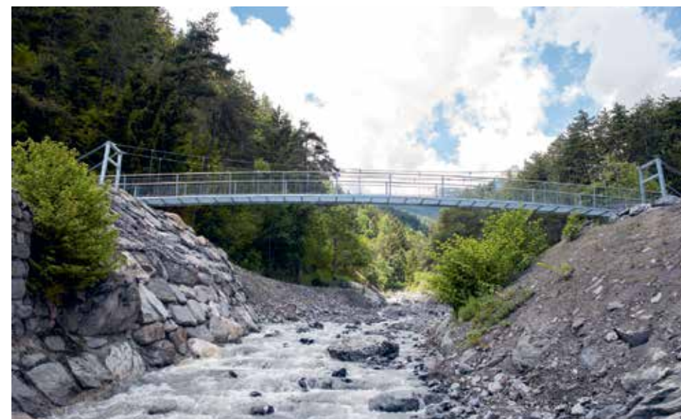
Les seuils et enrochements, comme ici près de la passerelle Angélie, à la sortie du Grugnay, permettent de stopper l'érosion du lit et de renforcer les digues.