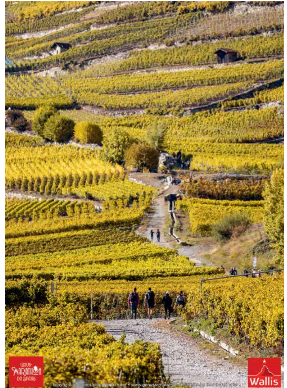
Chaque automne, les participants au Marathon des Saveurs empruntent le sentier «Du cep à la cime».

Le coût total de la mise en œuvre du PDR est de 12,1 millions de francs. Les contributions prévisibles de la Confédération et du Canton représentent respectivement 2,2 millions et 1,9 million de francs. Les communes de Chamoson, Riddes et Leytron devront participer ensemble à hauteur de 25% de la contribution cantonale. Le solde devrait être couvert par des crédits cantonaux. Chamoson investira 390'000 francs, pour une valeur ajoutée attendue de 363'000 francs par année.