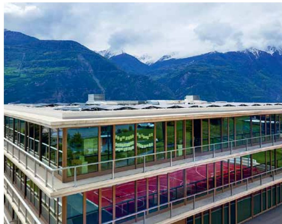
Le toit du Centre scolaire du Tsené arbore assez de panneaux photovoltaïques pour couvrir les besoins en électricité du bâtiment.

Sur le terrain de la déchetterie, les eaux de surface sont désormais collectées et traitées dans un décanteur avant de reprendre le fil du réseau. Et si tout va bien, un broyeur devrait bientôt trouver place vers le bas du site, sur la place réservée aux déchets verts, permettant aux usagers de repartir avec les copeaux de leurs branchages.